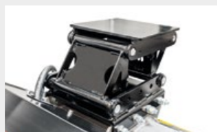
Lámina de acople con dispositivo de autonivelación para la excavadora